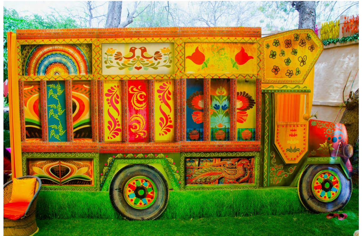
Camion peint camion peint décoré au mariage, Jodhpur, Rajasthan, Inde, Asie

Date de la prise de vue: 27 mars 2012 - ID de l'image: F6NH8K